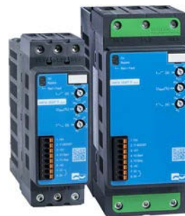
Arranadores VS II plus ...-38...105